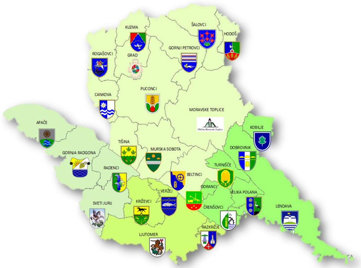
Slika 1: Območje priprave RRP 2021-2027

Apače, Beltinci, Cankova, Črenšovci, Dobrovnik, Gornja Radgona, Gornji Petrovci, Grad, Hodoš, Kobilje, Križevci, Kuzma, Lendava, Ljutomer, Moravske Toplice, Murska Sobota, Odranci, Puconci, Radenci, Razkrižje, Rogašovci, Sveti Jurij ob Ščavnici, Šalovci, Tišina, Turnišče, Velika Polana in Veržej.